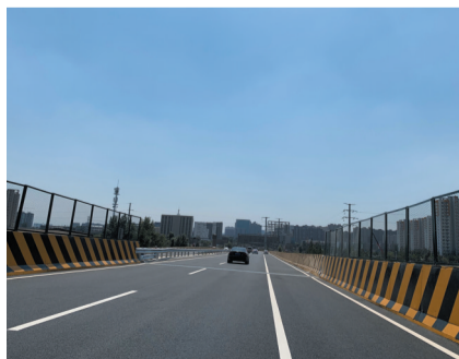
通车后的燕庄桥

开通当日，记者在燕庄桥现场看到，附近不少居民聚在一起，脸上洋溢着笑容。“我们以后出行方便多了……”大家话里话外流露出对未来方便、快捷生活的期待。