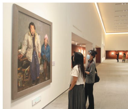
市民和游客在美术馆内观展

来自厦门的游客吕可说，通过观看新奇、时尚、多元的展览，能够感受到大同深厚的文化底蕴和独特的文化风貌，加上大同独特的风土人情、各种美食和丰富景点，真是不虚此行。 本报记者 王春艳