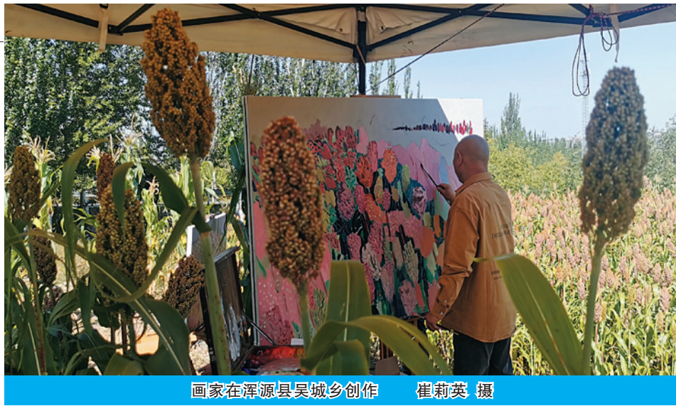
画家在浑源县吴城乡创作

记者了解到，连日来，除浑源外，左云月华池长城驿站、夏都国际写生基地、新荣区郭家窑乡塞尚驿站等摄影、写生基地内也驻扎有各地的摄影家、书画家，他们有的描摹长城秋色，有的聚焦长城古堡，创作了丰富多彩的艺术作品，纷纷表示不虚此行。