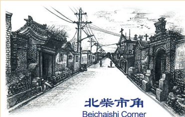
北柴市角 Beichaishi Corner