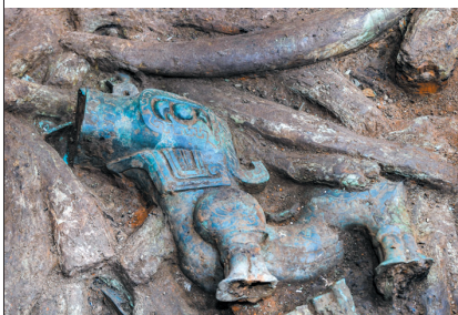
▲8号“祭祀坑”出土的青铜神兽。