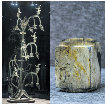
▲在三星堆博物馆拍摄的1号青铜神树(左图);3号“祭祀坑”出土的刻有树纹的玉琮(右图)。