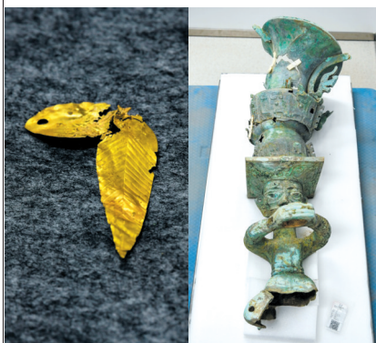
▲8号“祭祀坑”出土的金树叶(左图);3号“祭祀坑”出土的铜顶尊跪坐人像(右图)。