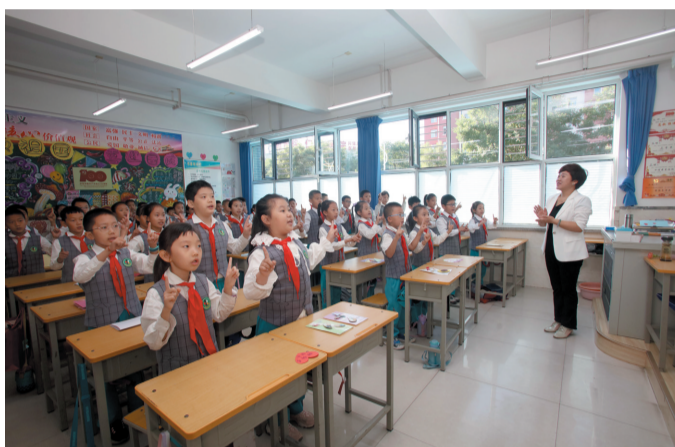
平城区14小三(4)班的学生为老师表演《听我说谢谢你》