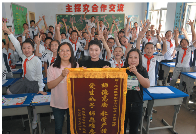
平城区44小六(4)班的学生向老师送锦旗

下午4时,北岳中学多媒体教室里,全体教育工作者齐聚一堂,举行庆祝第37个教师节暨“首届班主任日”表彰奖励大会。“烂漫的山花中,我们发现你。自然击你以风雪,你报之以歌唱……”伴随着动人的音乐,教师们一起重温张桂梅老师的感人事迹。师德标兵、班主任、青蓝工程师代表及学校领导先后上台发言,讲述教育中的动人故事及教育工作者肩负的历史使命,展现了当代教师的良好精神风貌。