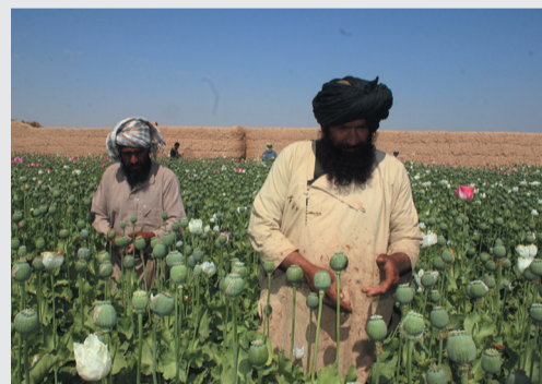
▲2019年4月4日，在阿富汗南部赫尔曼德省格里什克地区，阿富汗农民在罂粟田里劳作。(资料图)