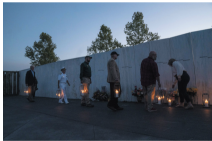
▲9月10日，在美国宾夕法尼亚州的93号航班国家纪念馆，人们提着蜡烛灯参加烛光纪念活动。

在美军2003年发动的伊拉克战争中，超过4000名美军士兵死亡，而伊拉克平民死亡人数估计为20万至25万人，其中美军直接致死超过1.6万人，约250万人沦为难民。