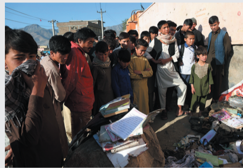
▲2021年5月9日，在阿富汗喀布尔，人们站在遇难学生的物品旁。前一天发生在喀布尔一所学校附近的爆炸袭击造成超过50人死亡，另有逾百人受伤。(资料图)

打也好、撤也罢，反正都是“美国决定”。那么，以前肆意干涉、四处点火的“战争账”，谁埋单？