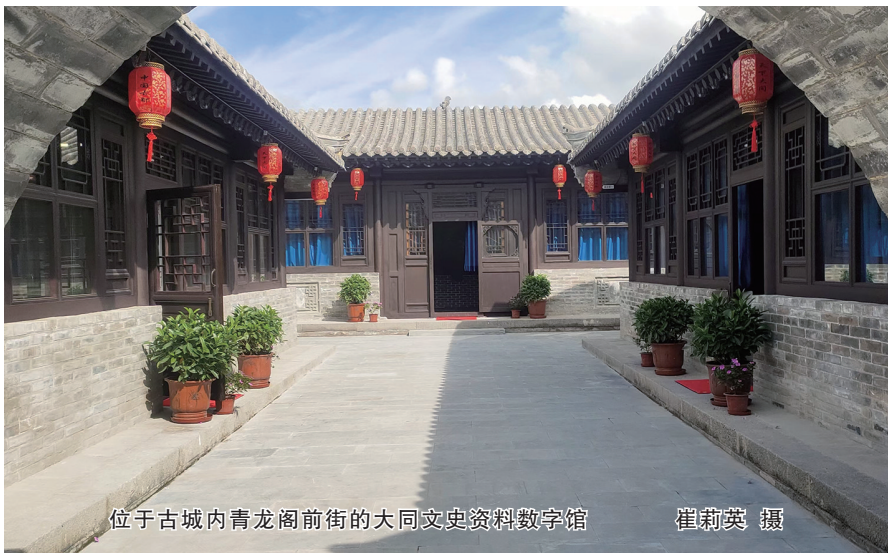
位于古城内青龙阁前街的大同文史资料数字馆