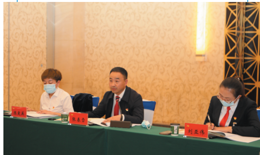
云州区代表团代表审议讨论报告