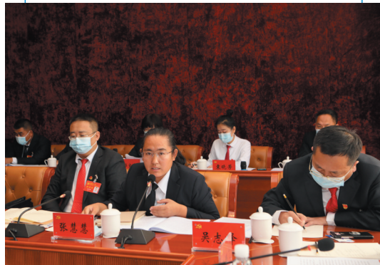
天镇县代表团代表审议讨论报告