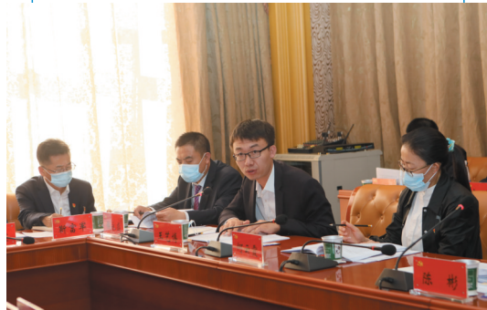
左云县代表团代表审议讨论报告