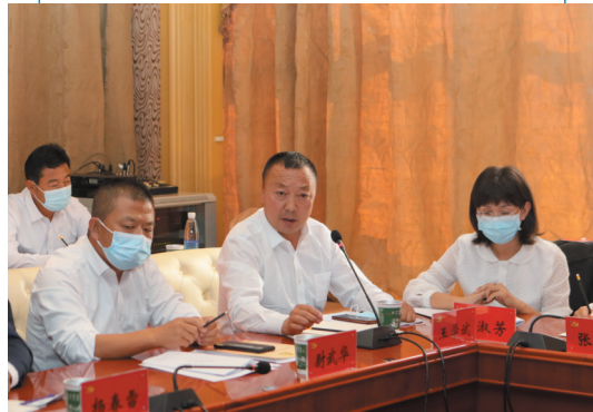
阳高县代表团代表审议讨论报告