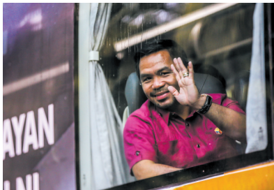
10月1日,参议员曼尼·帕奎奥在巴士内挥手致意。

10月1日至8日是菲律宾2022年大选登记参选的窗口期。随着多名候选人陆续提交竞选资格材料,菲律宾六年一度的选战正式拉开帷幕。其中哪些候选人值得关注?