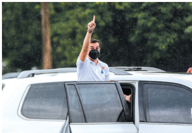
10月4日,马尼拉市长弗朗西斯科·多玛戈索向支持者挥手致意。