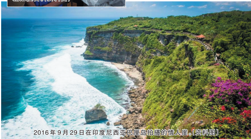
2016年9月29日在印度尼西亚巴厘岛拍摄的情人崖。(资料图)