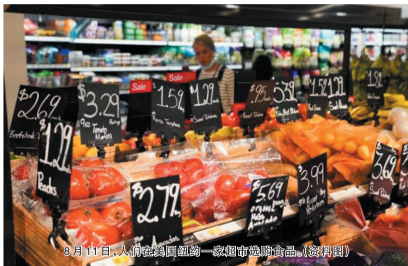
8月11日,人们在美国纽约一家超市选购食品。(资料图)

新冠疫情拖累物资运输与供应,美国部分商品价格上扬且供应不足。对此,财政部长珍妮特·耶伦12日接受媒体采访时呼吁民众“不要恐慌”。 耶伦接受美国哥伦比亚广播公司新闻部采访,谈及商品价格上涨时,指出这是“暂时的”。另外,在接下来一段时间,部分商品短缺或将持续,但在即将到来的圣诞购物季,应该有充足的供应,消费者没有理由感到恐慌。 “不过,我并不是说,这些压力会在一两个月内消失。”耶伦说,“这次全球经济所受冲击前所未有。” 耶伦说,供应链遭遇“瓶颈”,“等我们把新冠疫情控制住,全球经济复苏,这些压力就会减轻。我认为,届时将回归正常。” 美国联邦储备委员会先前同样安抚市场,预期通胀压力将减轻。然而,原油价格近期涨至多年来高点,每桶80多美元,加剧市场担忧。 据美国劳工部9月发布的数据,美国8月消费者价格指数同比上涨5.3%,仍处历史高位。能源价格上涨是推动消费者价格指数上涨的主要原因。