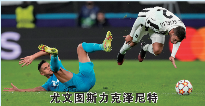
尤文图斯力克泽尼特

当日，在2021-2022赛季欧洲足球冠军联赛小组赛E组第三轮比赛中，德甲拜仁慕尼黑队客场以4:0战胜葡超本菲卡队。