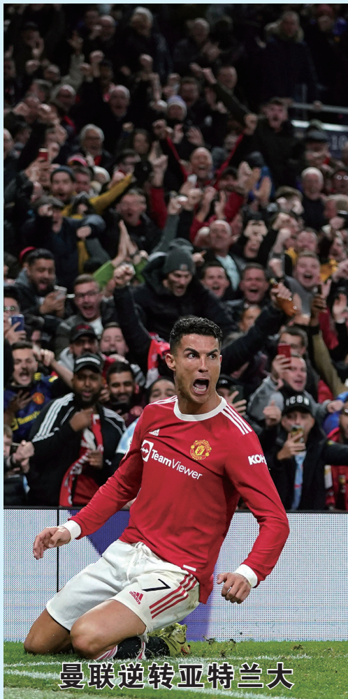
曼联逆转亚特兰大