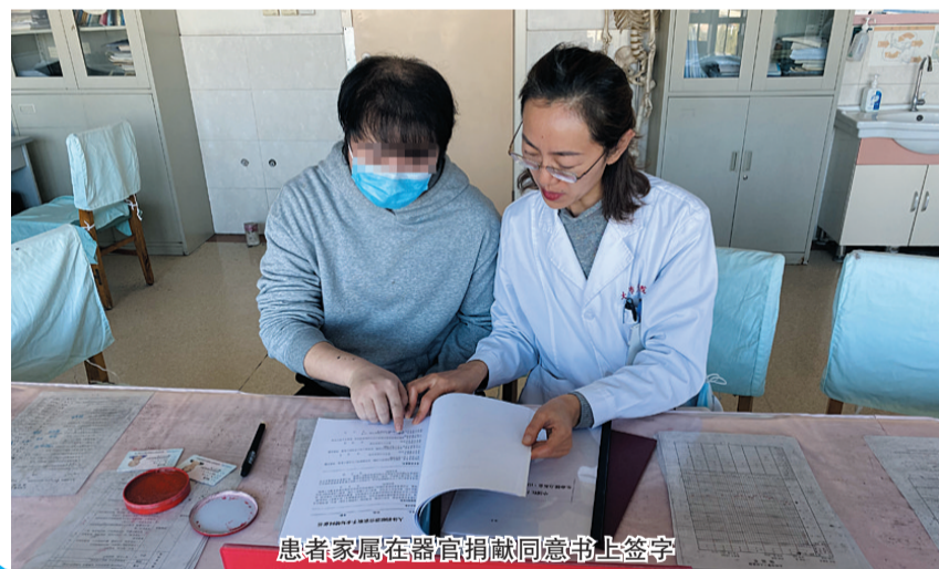
患者家属在器官捐献同意书上签字