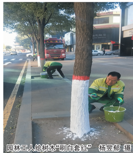
园林工人给树木“刷白套红”

平城区园林绿化中心有关负责人介绍,苗木刷白是每年入冬前为树木进行养护管理的一项重要工作。冬季,树皮因昼夜温差大很容易冻裂,通过给树木刷白,将过多的阳光反射掉,可以降低树木自身的温度,从而减少树干昼夜温差,不仅能起到防寒保暖作用,还能达到美观的视觉效果。