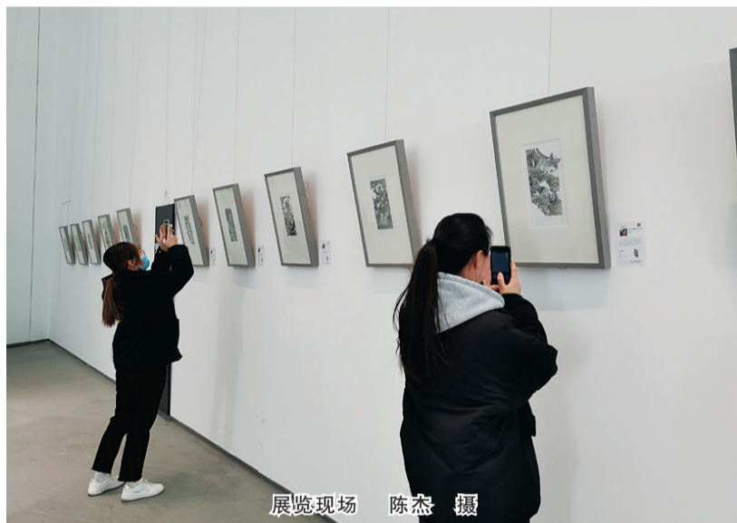
展览现场

本报讯（记者 陈杰）“这些版画展现了山西的好风光，很惊喜看到用版画来讲述华夏古文明。”23日，“风采中国 魅力山西”国际版画精品展在市美术馆1号展厅拉开帷幕，100余幅中外版画精品受到书画爱好者的欢迎。