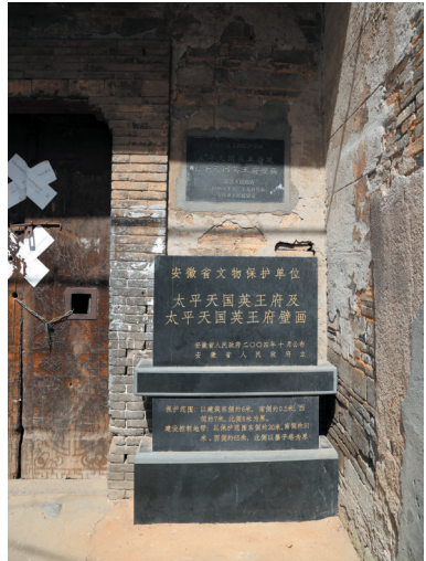
太平天国英王府旧址