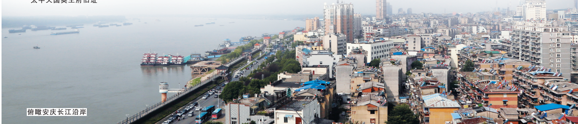
俯瞰安庆长江沿岸