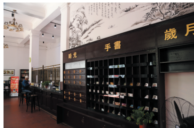
民国安徽省邮务管理局旧址