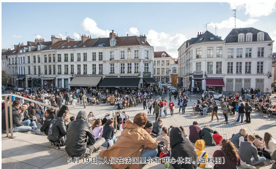
5月19日,人们在法国里尔市中心休闲。(资料图)