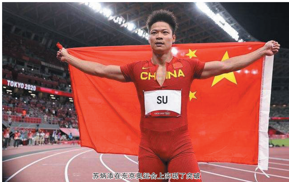
苏炳添在东京奥运会上实现了突破