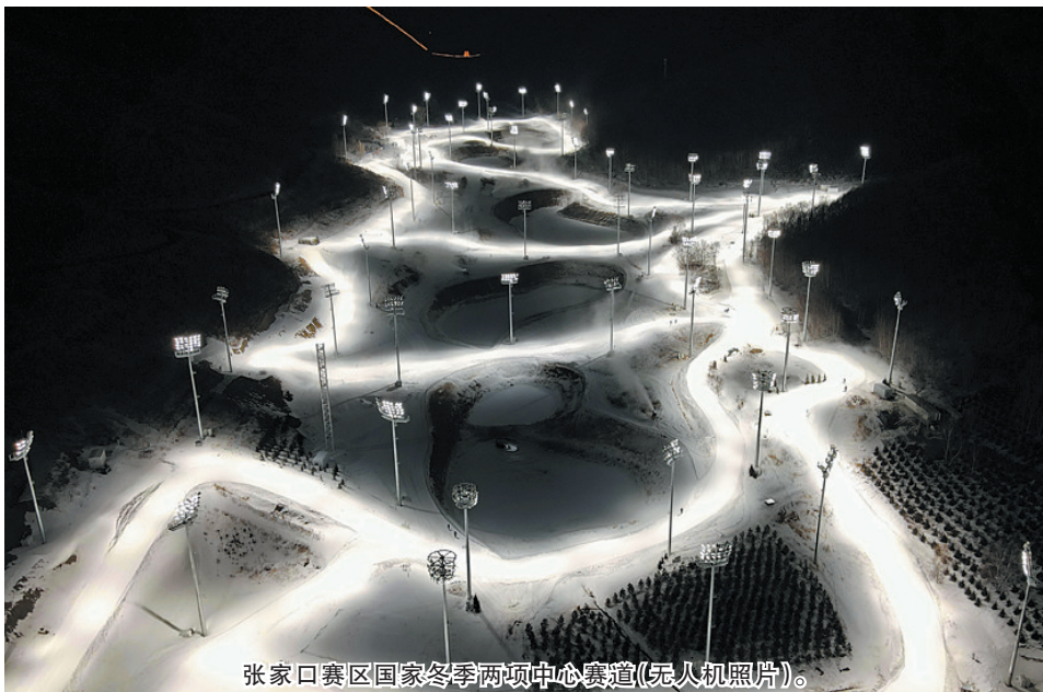
张家口赛区国家冬季两项中心赛道(无人机照片)。