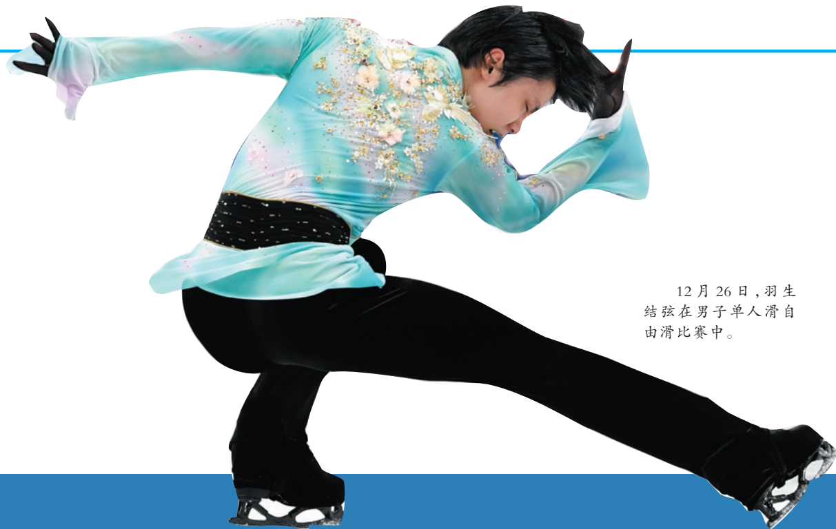
12月26日,羽生结弦在男子单人滑自由滑比赛中。

葛军透露,北京正积极谋划推动后冬奥时代冰雪运动的可持续发展。将充分利用冬奥遗产,积极申办国际雪联高山滑雪世界杯、国际滑联花样滑冰世界锦标赛等赛事,推动首都冬、夏季项目均衡发展,继续全面推进冰雪运动、群众体育、竞技体育、体教融合、体育产业等高质量发展。