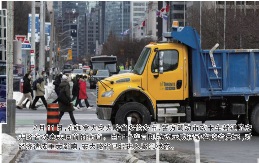
2月11日,在加拿大安大略省多伦多市,警方调动市政卡车封锁了安大略省议会大厦前的街道。由于卡车司机抗议示威活动在该省蔓延,对经济造成重大影响,安大略省已经进入紧急状态。

加拿大总理贾斯廷·特鲁多14日罕见地动用一项紧急法案,临时授予联邦政府更多权力,以平息该国持续多日的卡车司机抗议示威活动。