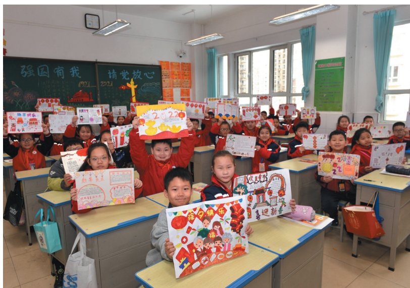
平城区45小四年级(7)班学生们展示手抄报

在平城中学，为了帮助学生快速安全入住，学校特意安排志愿者和教师帮助学生拿行李。“很开心又回到了美丽的校园，见到了熟悉的老师和同