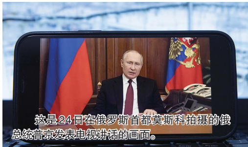
这是24日在俄罗斯首都莫斯科拍摄的俄总统普京发表电视讲话的画面。

俄罗斯总统普京24日宣布在顿巴斯地区发起特别军事行动。他说,俄罗斯无意占领乌克兰。