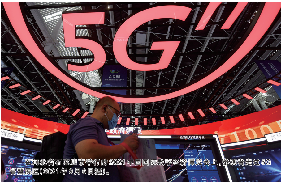
在河北省石家庄市举行的2021中国国际数字经济博览会上,参观者走过5G智慧展区(2021年9月6日摄)。

政府工作报告指出,经济增速预期目标的设定,主要考虑稳就业保民生防风险的需要,并同近两年平均经济增速以及“十