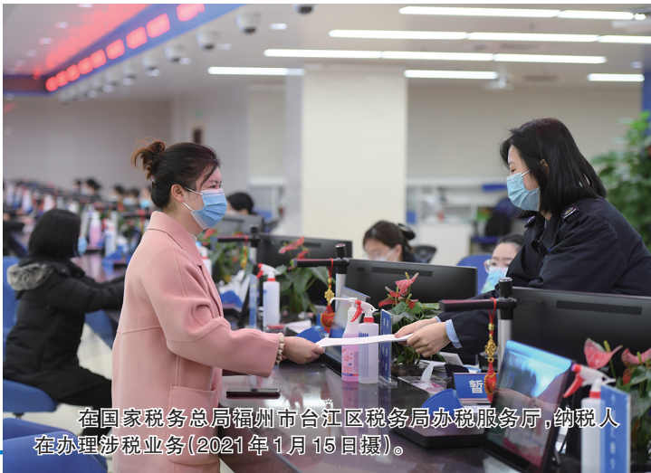
在国家税务总局福州市台江区税务局办税服务厅,纳税人在办理涉税业务(2021年1月15日摄)。

5日提请十三届全国人大五次会议审议的政府工作报告,提出一系列新目标新部署,传递出中国经济社会发展新信号。