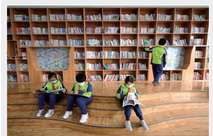
▲河北省石家庄市桥西区裕华西路小学参加课后托管的学生在图书馆阅读(2021年3月11日摄)。