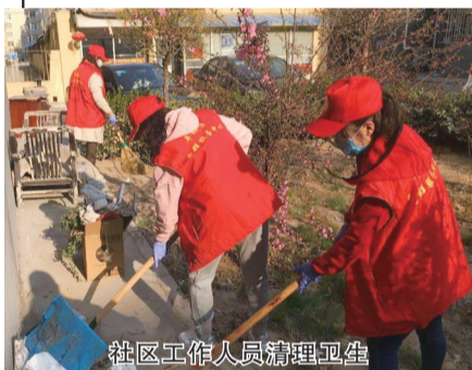
社区工作人员清理卫生

结合“学雷锋活动月”,该街道以新时代文明实践站为载体,组织广大志愿者开展家电维修、医疗保健、法律援助、卫生清洁等便民服务,切实提升群众的获得感、幸福感和安全感。