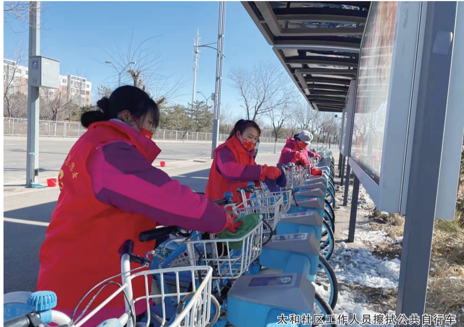
太和社区工作人员擦拭公共自行车

太和社区工作人员联合市诚博美居物业锦瑞和源服务中心,共同开展志愿服务活动,对辖区公共自行车进行清洗、擦拭。随后,工作人员又来到附近公交站点,清洁公交站。经过3个小时的努力,百余辆公共自行车和多个公交站点焕然一新。