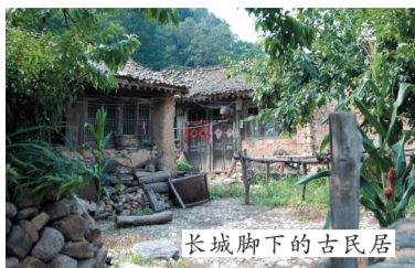
长城脚下的古民居