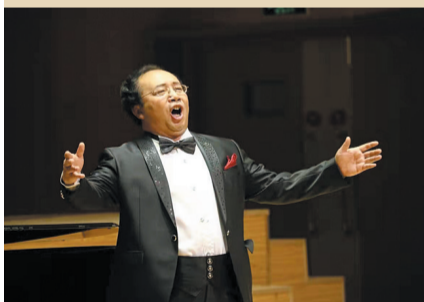
白成参加第八届全国煤矿职工声乐展演