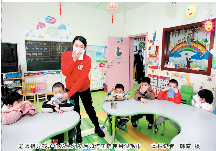
老师指导孩子们发生火灾后如何正确使用湿毛巾