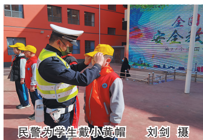
民警为学生戴小黄帽

活动中,民警还通过大同交警抖音、快手平台全程进行了直播,并给直播间的家长们讲解系安全带、佩戴头盔的重要性及中小学生学习上下学需要注意的交通安全常识,直播间观看人数达3.5万人次。