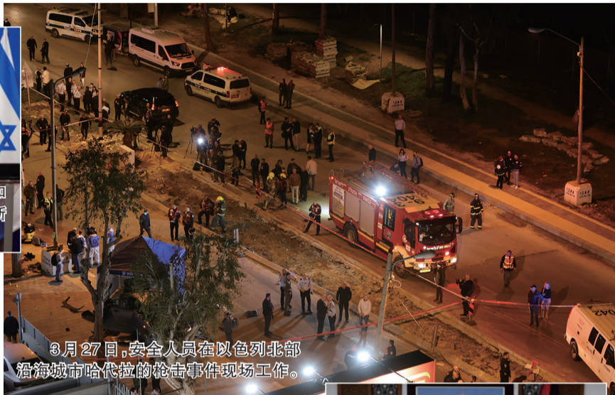
3月27日,安全人员在以色列北部沿海城市哈代拉的枪击事件现场工作。