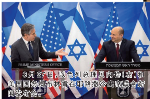
3月27日,以色列总理贝内特(右)和美国国务卿布林肯在耶路撒冷出席联合新闻发布会。

美国国务卿安东尼·布林肯27日抵达以色列,准备出席一场罕见的由以方“做东”、地区四个阿拉伯国家参与的外长级会议。不过,极端组织“伊斯兰国”认领当天发生在以色列境内的一起袭击,令本次会议召开气氛多少受到影响。