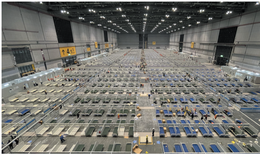
4月8日拍摄的国家会展中心(上海)方舱医院。

最多时有近3万名管理人员和作业人员同时在场。记者这两天走访时,时不时地看到各种走道里放置着一排排还没来得及及收拾的地铺。