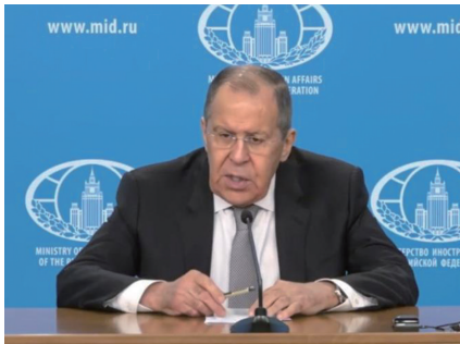
这张1月14日的视频截图显示，俄罗斯外交部长拉夫罗夫在莫斯科召开年度记者会。(资料图)

拉夫罗夫讲话前一天，美国国务卿安东尼·布林肯和国防部长劳埃德·奥斯汀访问乌克兰，承诺将向乌方提供更多武器援助。美国国务院25日说，布林肯在会谈中告知乌方，美国将向乌克兰和中东欧及巴尔干地区15个北约盟友和伙伴国家提供总额超过7.13亿美元的军事援助资金，其中逾3.22亿美元授予乌