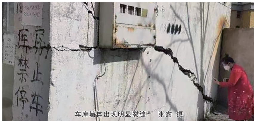
车库墙体出现明显裂缝

记者随后联系了负责该小区管理的大同皓博物业管理有限公司,该公司负责人表示,收到业主反映的问题后,他们派人去查找问题的原因。工人将1号楼3单元门前路面挖开后发现,墙体