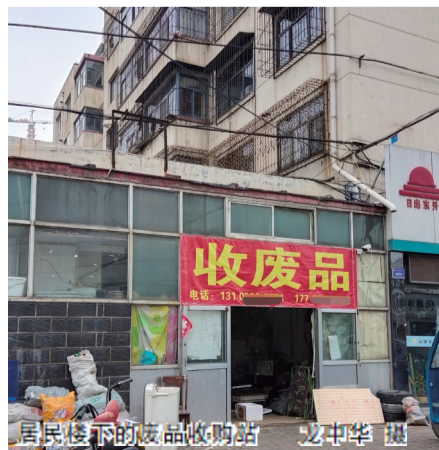
居民楼下的废品收购站

本报讯(记者 龙中华)“媒体曾经多次报道过,居民楼下开设废品回收站存在安全隐患。我们楼下也开着一家废品回收站,让我们整天提心吊胆,生怕发生火灾。”8日,家住平城区雁运家属楼小区的顾女士向记者反映。