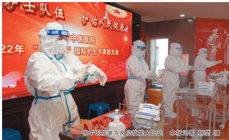
市中医院举办岗位技能大比武

“柔情的双手迎接生命的希望,温馨的话语呼唤健康在起航,轻盈的脚步驱散病痛的阴霾……”昨日上午,2022年大同市医疗机构纪念“5·12”国际护士节暨优秀护理单元与个人表彰会在嘹亮的《中国护士之歌》歌声中拉开序幕。