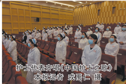
护士代表齐唱《中国护士之歌》

据了解,为进一步树立典型,表彰先进,市护理学会在全市医疗卫生机构开展了“优秀护士”“优秀护理管理人员”“优秀护理单元”“先进护理集体”评选表彰活动。经各单位推荐,组织审核等程序,授予市一医院护理部等4个团体“先进护理集体”荣誉称号;授予市二医院护理部等11个团体“优秀护理单元”荣誉称号;授予于雅玲等11名同志“优秀护理管理人员”荣誉称号;授予王园园等55名同志“优秀护士”荣誉称号。同时,还对在抗击新冠肺炎疫情期间无私奉献奔赴外地支援的护理人员,授予“抗疫白衣战士”称号。