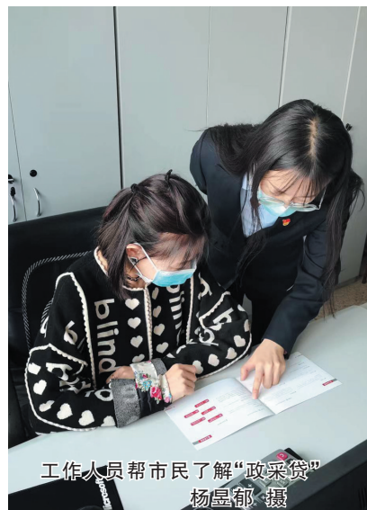
工作人员帮市民了解“政采贷”

为推动“政采贷”业务发展,工商银行大同分行主动出击,组织各业务团队对相关业务和系统进行了培训学习。接下来,工商银行大同分行将进一步积极探索,对接有需要的客户,扶持中小微企业健康发展。