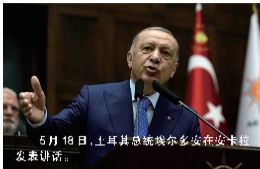
5月18日，土耳其总统埃尔多安在安卡拉发表讲话。

芬兰和瑞典18日正式申请加入北大西洋公约组织后，土耳其总统埃尔多安当天晚些时候重申，土方反对芬、瑞两国加入北约，因为这两国没有同意土方引渡“恐怖分子”的要求。