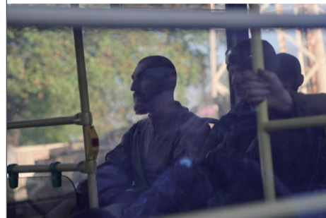
5月17日，在马里乌波尔，乌克兰武装人员乘坐巴士离开。

俄罗斯国防部发言人科纳申科夫18日发布通报说，过去一昼夜，694名被围困在乌克兰马里乌波尔亚速钢铁厂内的乌军和乌方军事力量“亚速营”人员投降，其中包括29名伤员。