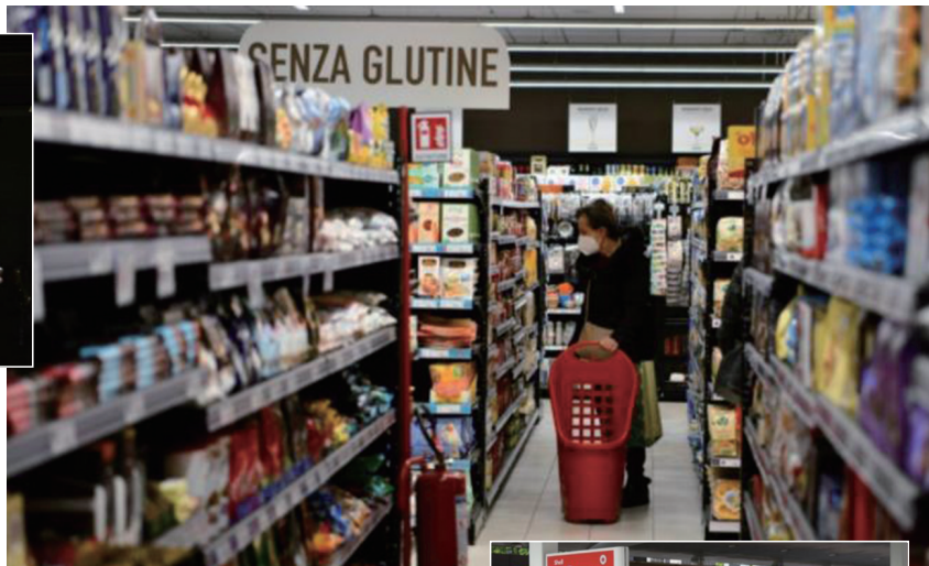
▲ 4月1日，顾客在意大利罗马一家超市购物。(资料图)