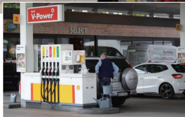
▲ 5月11日，一名男子在德国首都柏林一处加油站加油。(资料图)

消息人士20日说，在与欧洲联盟方面沟通后，德国和意大利政府已允许两国企业在俄罗斯银行开设卢布账户，以继续购买俄天然气。