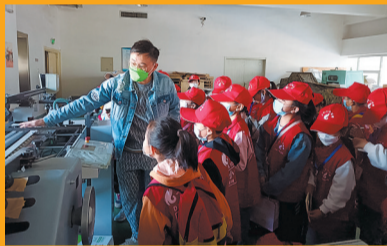
工作人员向小记者介绍印刷设备。