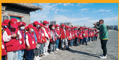
小记者编辑部老师讲解城墙文化。

每一次难忘的实践活动,都让大同日报小记者收获满满。小记者参与不同的主题活动,从中学到了许多课堂之外的知识,既增强了观察能力,增长了见识,收获了快乐,又度过了一个充实的周末。