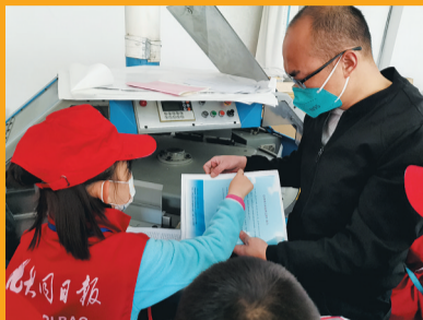
工作人员讲解印刷工作流程。