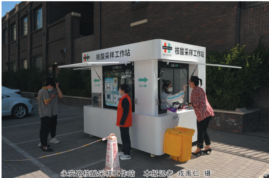
永安路核酸采样工作站

热,我们也必须全程穿着医用防护服。”一名采样人员笑着对记者说,如今在工作站里,环境好不说,工作时一般只需穿着隔离衣或普通工作服,就可通过玻璃上的操作孔为市民完成采样。刚接受完核酸采样的市民李女士也表示,她是第一次体验这种无接触式核酸检测方式,不仅方便还安全。