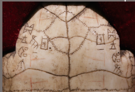
龟甲上的刀刻文字