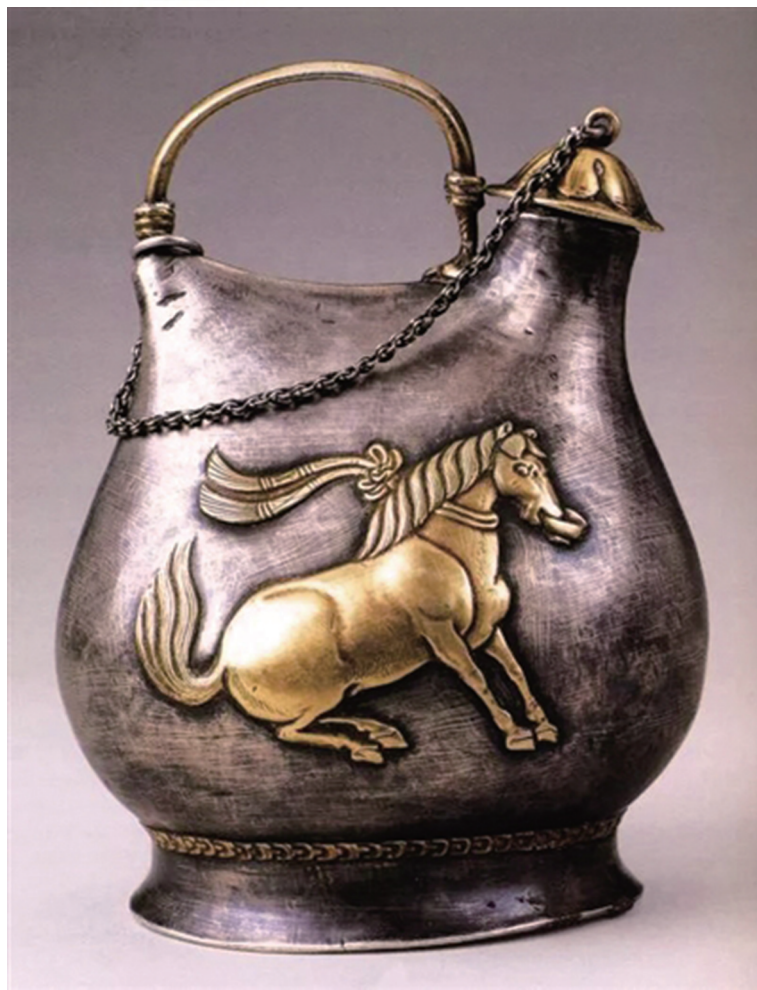
→ 鎏金舞马衔杯纹银壶 (陕西历史博物馆藏)

从古至今，金银之类的硬通货在交易中都扮演着重要角色。虽然历朝各代都有自己的货币，但金银的价值一直未被低估，尤其是在纸币出现之前，最具保值作用的贵金属莫过于“真金白银”。那么，金银在古代市场中究竟扮演了什么样的角色呢？