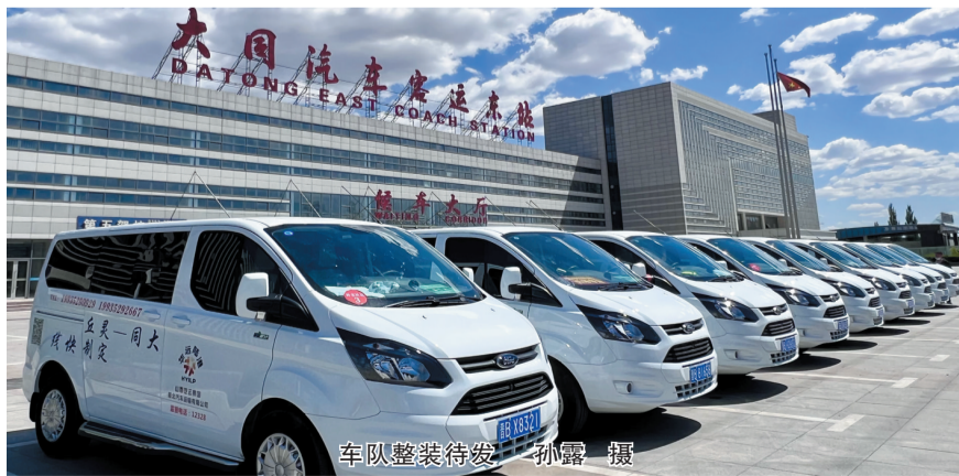
车队整装待发

据了解，大同⇌灵丘定制快线采用的是网上购票模式，全面实施科学调度、信息化管理，确保优质准点、安全有序运行。灵丘县城及市内平城区、云冈区免费上门接送，票价60元，试运营期间推出优惠价50元，发车时间大同6:00、灵丘5:00—17:30循环发车，全程高速，一站直达。广大市民可关注微信公众号“大同视野”，进入“灵丘快线”的购票链接，根据实际出行需求，选择合适的班次进行购票，运营方