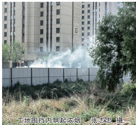
工地围挡内飘起浓烟