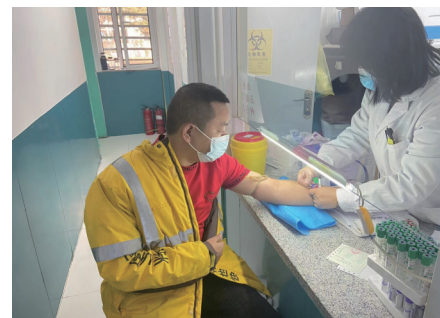
一名加入工会的外卖小哥正在接受免费体检。

在城市的不同角落,活跃着这样一个群体:早出晚归、奔波四方的货车司机;穿梭于大街小巷,为人们带去便利的快递小哥、送餐骑手……如今,他们有了一个相同的称呼:新就业形态劳动者。记者日前从市总工会了解到,我市各级工会组织以劳动者为本,通过多种措施和渠道,逐步把新就业形态劳动者入会工作引向深入。