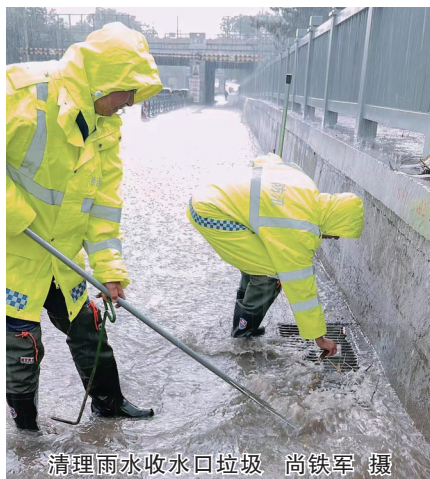
清理雨水收水口垃圾

“拥军路泵站大雨,有积水;南环西路四号泵站桥涵通行正常,中雨无积水;和一路桥涵中,有少量积水,通行正常……”6月27日23时30分,市城市管理局的市政防汛工作群信息此起彼伏,指挥员通过视频监控、对讲机、微信群、电话等汇总路面积水、车辆通行等情况,并及时调配人员、物资、车辆到各积水点进行处置。防汛人员及时打开阀门及道路两侧雨水井盖,并设置警戒线、清理杂物,加大雨水排量。23时35分,雨渐停,直到6月28日0时55分,市政防汛工作群才终于安静下来。