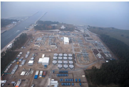
2011年11月8日，在德国北部城市卢布明，由俄罗斯连接德国的“北溪”天然气管道正式投入使用。（资料图）

德国政府发言人8日证实，德方希望加拿大放行德国西门子公司送修的“北溪-1”天然气管道部件，已得到加方“积极”回应。