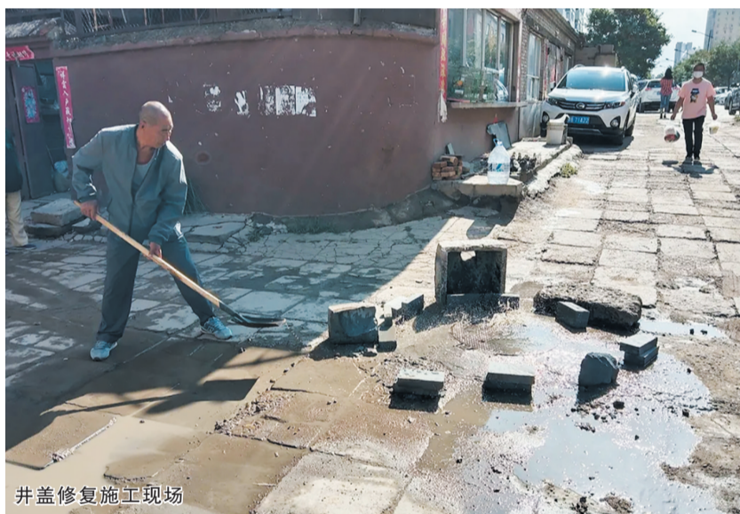
井盖修复施工现场

据了解，老人之前已联系过两家施工队，上门查看后均表示无法处理。随后，社区党支部赶快联系相关部门，由专业维修人员上门进行美化处理。第二日上午，社