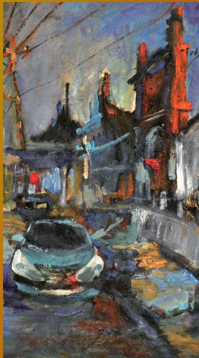
每一条街巷均见证着时代的变迁