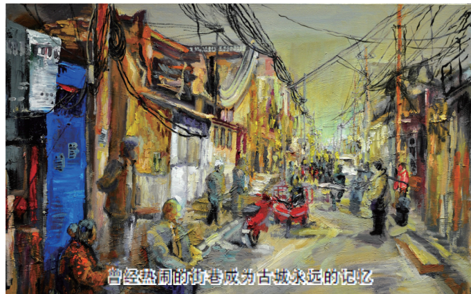
曾经热闹的老街巷成为古城永远的记忆