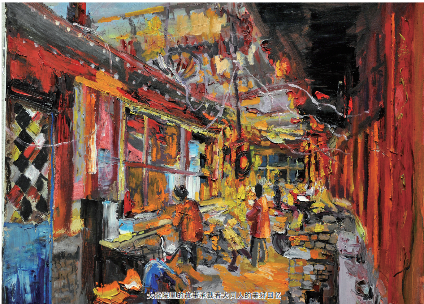
大院里的故事承载着大同人的美好回忆