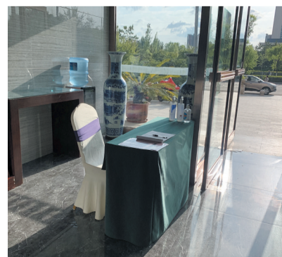
部分酒店防疫岗形同虚设

28日上午11时30分，在云冈大酒店，记者看到这里的工作人员全部佩戴口罩。门口虽然用隔离带对出入人员进行了分离，但有人进入时却未见工作人员上前提醒扫码。在前台办理入住手续的游客有戴口罩的、也有未戴口罩的，在整个服务过程中，工作人员也未提及测温、扫码、查验核酸等疫情防控相关要求。