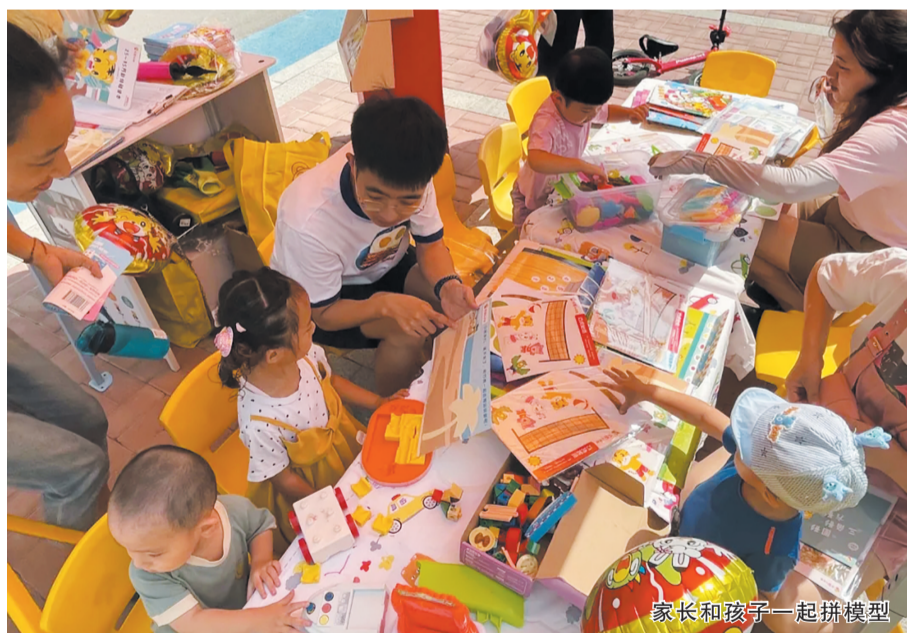
家长和孩子一起拼模型

联系方式,最终将老人送回家中。老人的儿子紧紧握住工作人员的手激动地说:“多亏了你们的帮助,才能第一时间找回自己的父亲。”社区工作人员叮嘱其要照顾好老人,避免老人单独外出,还提醒他们要为老人定制专门卡片,将家庭地址、电话号码缝到衣服上,以备不时之需。