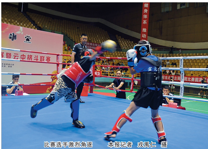
比赛选手激烈角逐

考生完成网上转考（转出）申请后，本人须携带身份证、山西省高等教育自学考试历次合格课程查询（2001年后）、转入地准考证、转入地成绩单，在规定时间内前往考籍所在市自考部门进行现场确认、提交材料。