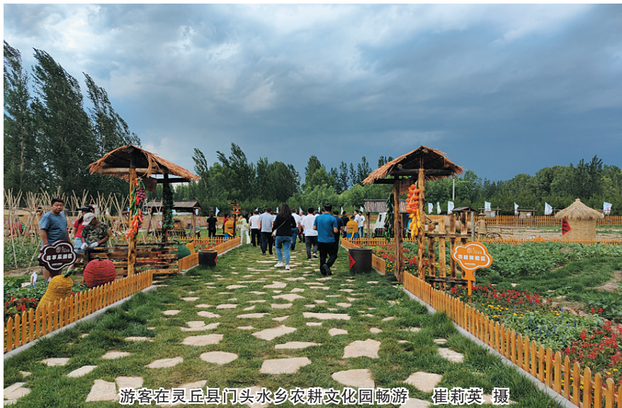
游客在灵丘县门头水乡村耕文化园畅游

我市多个县区持续推动“红色旅游+”，把红色文化和自然资源相结合，盘活旅游资源。灵丘县文旅局负责人介绍，该县依托一百多处红色资源开发出一批特色旅游项目，打造了以平型关为代表的红色旅游目的地，推出“三五九旅是模范之旅”“沿着白求恩的足迹之旅”等主题乡村旅游。近日，平型关大捷纪念馆、杨庄白求恩特种外科医院旧址等处，学