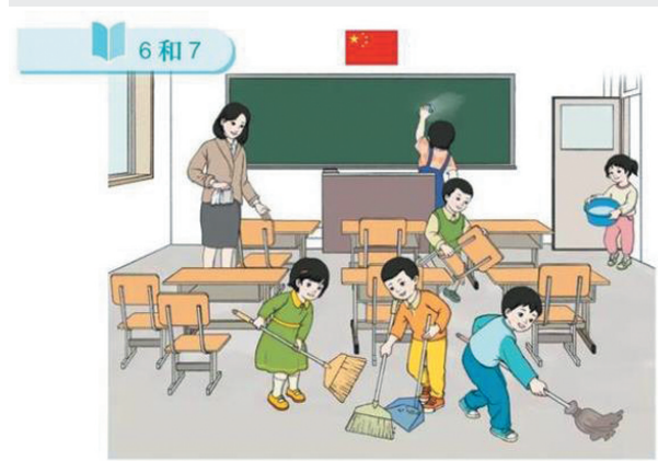
选自一年级上册,以打扫教室卫生的场景进行认数教学。

教育部表示,针对人民教育出版社小学数学教材插图问题,教育部举一反三,部署对全国中小学教材教辅和进入校园课外读物的插图及内容进行了全面排查整改,确保体现正确的政治方向和价值导向,弘扬中华优秀传统文化,符合大众审美习惯。