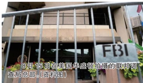
8月15日在美国华盛顿拍摄的联邦调查局总部。(资料图)

美国前任总统唐纳德·特朗普22日发起诉讼,请求联邦法院任命一名特别主事官负责监督审阅从海湖庄园“抄”走的文件,阻止联邦调查局(FBI)审阅这些文件。这是特朗普两周前遭“搜家”后首次针对这一执法行动发起法律诉讼。