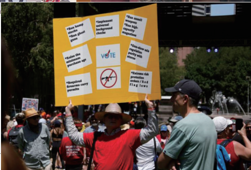
► 5月27日,在美国得克萨斯州休斯敦,一名参与者高举标语牌呼吁控枪。(资料图)

释”,也就是必须找到美国建国以来的相关“历史先例”作为依据,被诉的枪械管制法律条文才可认定符合宪法。