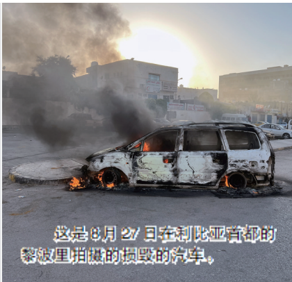
这是8月27日在利比亚首都的黎波里拍摄的损毁的汽车。

多家媒体报道,这是的黎波里近两年来爆发的最激烈冲突。外界担忧,利比亚近几个月来陷入政治僵局,如果持续的话可能导致全国范围大规模武装冲突。