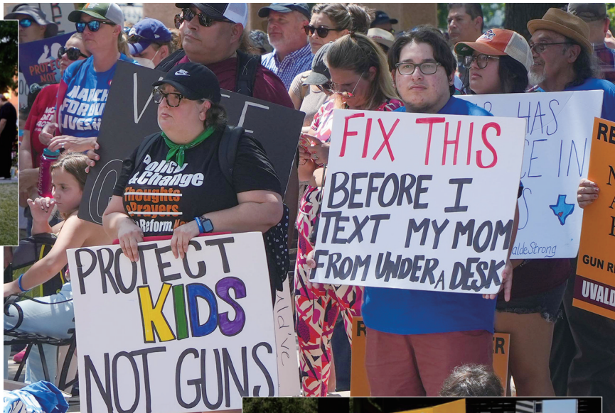
▲ 8月27日,人们在美国得克萨斯州首府奥斯汀参加集会呼吁控枪。

保守派大法官占多数的美国联邦最高法院6月做出裁决,认定美国宪法第二修正案赋予本国个人出于自卫目的在公共场合携带武器的权利,同时指示美联邦司法机关在审理有关枪械管制法律的诉讼时,判定某法律条文是否违宪的标准不再是“是否符合公共利益”,而是“是否符合宪法第二修正案文本及其历史解释”。