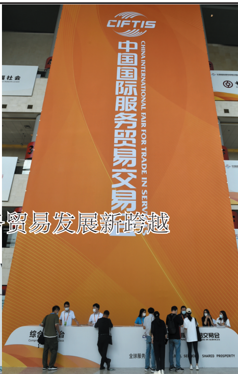
▲9月3日拍摄的2022年服贸会国家会议中心展馆内景。