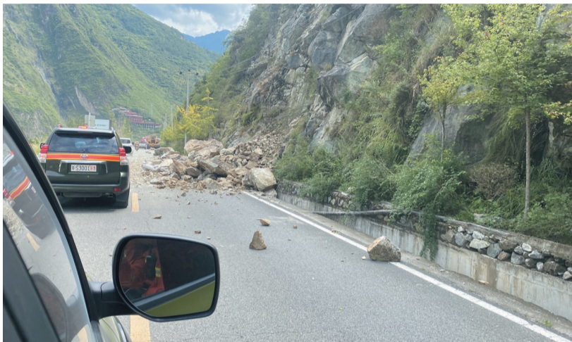
▲这是9月5日四川省森林消防总队甘孜支队在前往泸定县的路上发现的塌方情况。

据悉,四川已出动应急救援、武警、消防、交通、医疗、公安等救援力量第一时间赶赴地震灾区开展救援抢险。地震已造成灾区道路、通信、房屋等局部受损,具体受损情况仍在核查中。