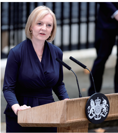
▲9月6日，新就任的英国首相伊丽莎白·特拉斯在位于伦敦唐宁街10号的首相府发表讲话。

不过，保守党同时被指歧视少数族裔和女性。少数族裔选民总体更倾向于支持在野党工党。刚卸任的保守党籍前首相鲍里斯·约翰逊因发表过涉及穆斯林妇女着装的不当言论而在2019年公开道歉。